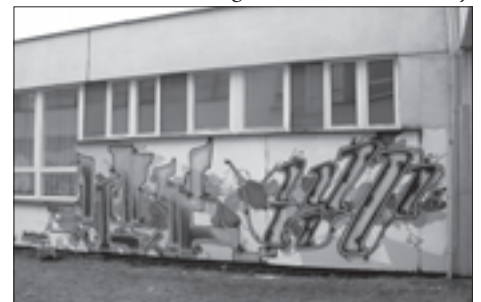
Jednou z významných akcí tohoto školního roku byl projekt GRAFFITI