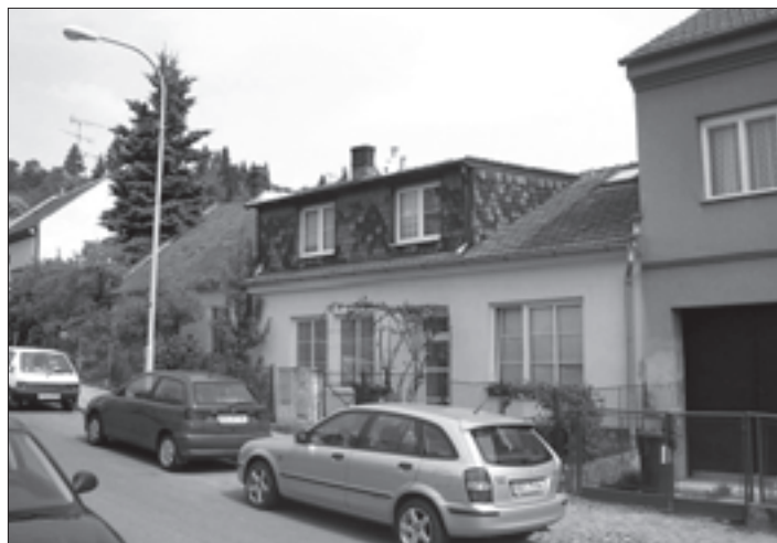
Současný stav po rekonstrukci a vybudování střešní nástavby.