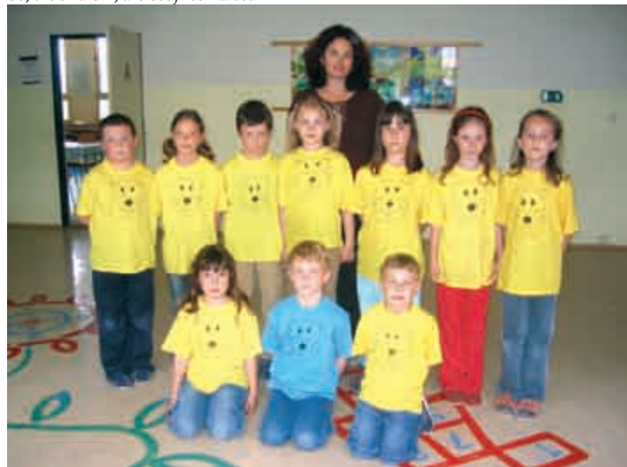
Děti 1.AB ŠD