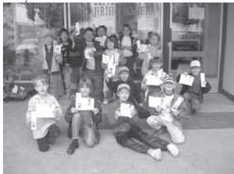
Prvníáci v Knihovně J. Mahena na Oblé.

Měsíc červen má ve školním roce nepochybně zvláštní a trochu rozporuplnou atmosféru. Zcela jinak ho prožívají děti úspěšné, které se mohou těšit na pěkné známky, pochvaly a dárky od rodiny – jiná atmosféra panuje tam, kde výsledky jsou spíše zklamáním, kde je dítě z nejrůznějších důvodů ve škole neúspěšné. Stupňuje se zkoušení a zároveň se s „přibývajícím teplem“ blíží prázdniny. Prolínají se tady obavy a očekávání.