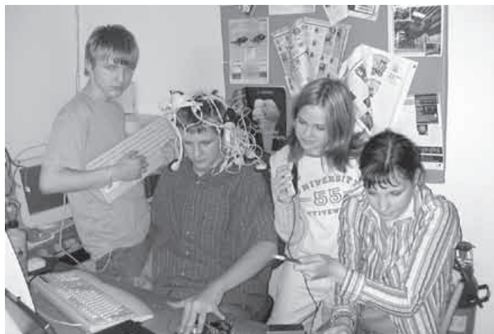
Počítačová „fanatic“ při práci v mezinárodním projektu „Mládí a vědění - Join Multimedia“

Další podrobnosti budou uvedeny ve výroční zprávě školy, která bude po 15. červenci 2004 k dispozici na našich webových stránkách v sekci Výroční zpráva.