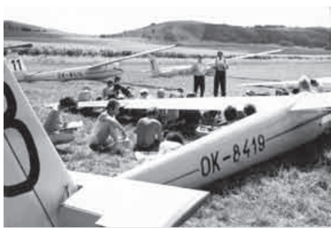
Šesté plachtařské mistrovství Moravy (Medlánky 1973) vyhlášení disciplíny

Aeroklub Brno-Medlánky a Městská část Brno-Medlánky si Vás dovoluují pozvat na Oslavy 80. výročí konání I. národní soutěže plachtových letadel v Československé republice