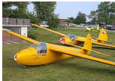
Šohaj a Kmotr po renovaci v letuschopném stavu před provozní budovou AK Brno-Medlánky (2002)

Akce je realizována v těsné spolupráci s Aeroklubem České republiky, Aeroklubem Slatina (Tuřany), Leteckou amatérskou asociací, Katedrou letectví VUT Brno, Vojenskou akademií Brno a dalšími subjekty. Jako realizátory a organizátory akce nás rovněž těší zapojení Armády České republiky do přípravy a realizace akce, vč. jejího příslibu