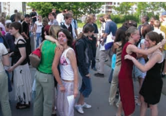
Loučení devátáků se základní školou bylo dojemné.

Automobilky vyrábějí automobily. Na běžícím pásu. Každý rok jich vyrobí pěkných pár tisíc. Tento svůj výrobek, za který jsou odpovědní svému klientovi, označují nápisy Turbo, Diesel, TDI, LX, GLX a kdo ví jak ještě. To aby klient věděl, jak se výrobek povedl a jaké jsou jeho přednosti.