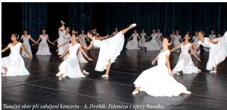
Taneční obor při zahájení koncertu - A. Dvořák: Polonéza z opery Rusalka